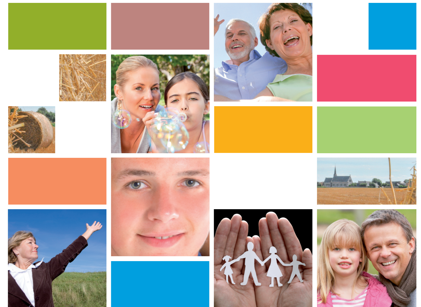
Conception : MSA Mayenne-Orne-Sarthe - Impression : Bemographic - Mai 2016